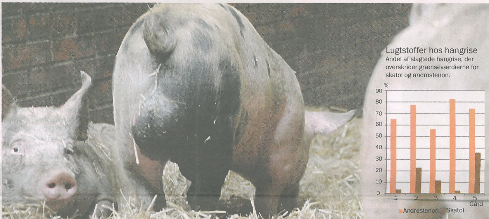
Lugtstoffer hos hangrise Andel af slagtede hangrise, der overskrider grænseværdierne for skatol og androstenon.